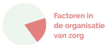
Factoren in de organisatie van zorg

V&V-professionals werken met mensen uit verschillende culturen en in verschillende sociale omgevingen. Zorg moet voor iedereen toegankelijk zijn. Soms zorgen vooroordelen of slechte communicatie voor problemen. Diversiteit is een belangrijk thema en kan invloed hebben op diagnose en behandelingen. Daardoor heeft diversiteit ook invloed op de beantwoording van kennisvragen.