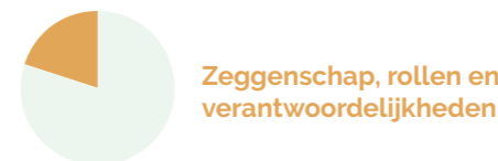
Zeggenschap, rollen en verantwoordelijkheden

V&V-professionals hebben een belangrijke rol in voorlichting en educatie als zij zorg verlenen. Zij informeren zorgvragers en hun naasten over hun ziekte en behandelingen. Dit helpt zorgvragers en hun naasten beter te begrijpen wat er gebeurt en wat ze zelf kunnen doen. Hierdoor zijn zorgvragers actiever betrokken bij beslissingen over hun behandeling. Ook houden ze zich misschien beter aan de behandeling. Goede voorlichting is dus een belangrijk thema bij de beantwoording van kennisvragen.