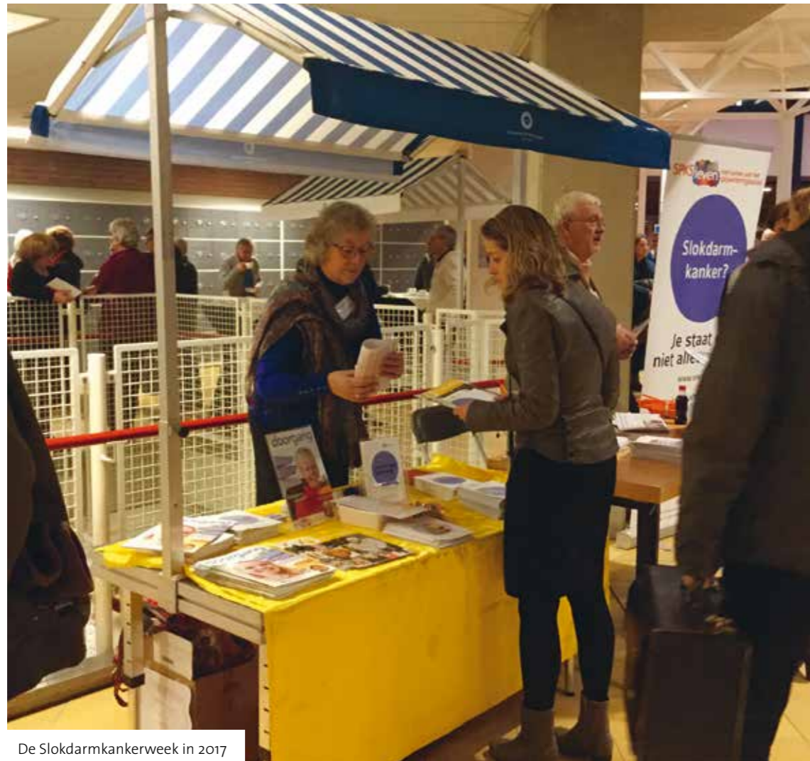
De Slokdarmkankerweek in 2017